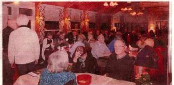
GODT BESØKT: De fleste stolene var opptatt under historielagets releaseparty på Ørnes hotell.