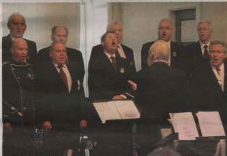
OPPHAV I MELØY: Nordre Meløy mannskor synger fredag "I en sal på hospitalet, skillingsvisa med røtter i Meløy.