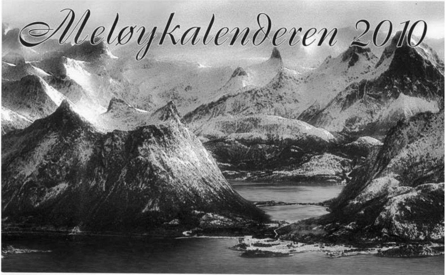
Trollfjell». Bildet viser Amøya i forgrunnen.